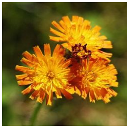
Orangrotes Habichtskraut im Staudenbeet

Bodenbedecker können mehrjährige oder einjährige Pflanzen sein. In Gemüsebeeten sind Bodenbedecker, wie gesäter Nüsslisalat, gerade im Winter eine willkommene Begrünung, die im Frühling das Unkraut unterdrückt, den ersten Gartensalat gibt und beim Bestellen der Beete einfach entfernt werden kann.