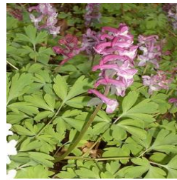
Lerchensporn unter Bäumen