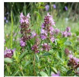
Thymian beim Gewürzbeet